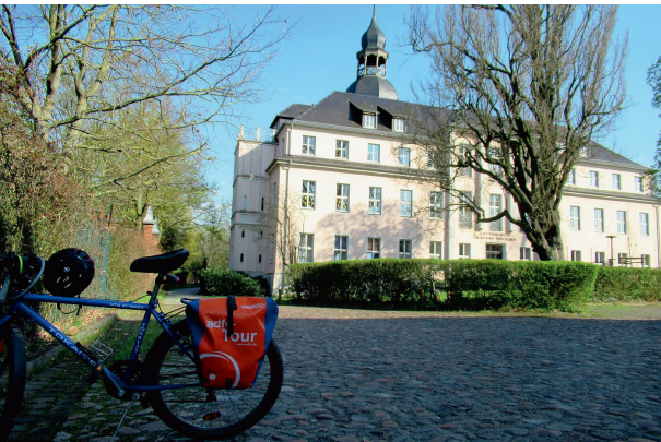
Schloss der Grafen von Hagen in Möckern

Wir fahren auf gut ausgebauten Wegen ohne nennenswerte Steigungen. Es ist eine moderate Geschwindigkeit geplant, so dass Freizeitradler willkommen sind. Ausreichend Pausen sind vorgesehen. Bitte Verpflegung und Getränke einplanen.